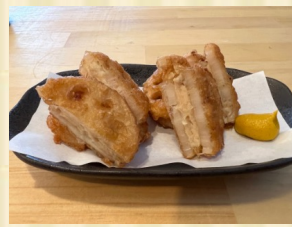
もちシャキれんこん挟み揚げ Deep fried lotus root and minced chicken