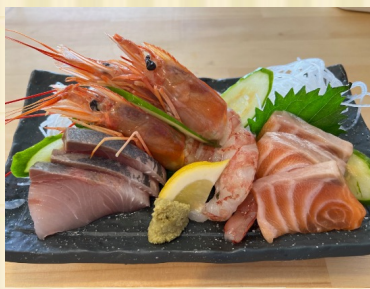
日替わり刺身3種盛り合わせ Daily Seasonal Sashimi (3 varieties)