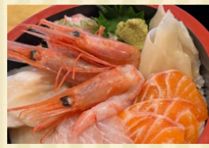
特選！海鮮5種丼(数量限定) Sashimi Bowl – 5 varieties (Limited Supply)