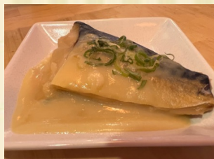
サバの味噌煮 Saba with miso