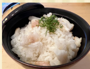
鯛めし Red snapper mix rice