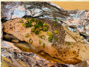
鮭のホイル焼き Steamed salmon