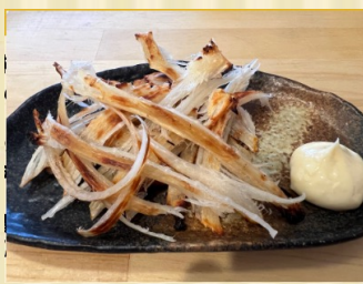
やわらか炙りエイヒレ Broiled Stingray fin