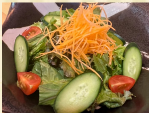
サラダ盛り合わせ Fresh salad