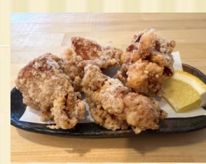
鶏のから揚げ Deep fried chicken