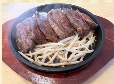
極上！鉄板ハラミステーキ Grilled Skirt Steak