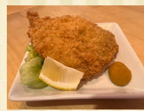
肉厚アジフライ Deep fried horse mackerel