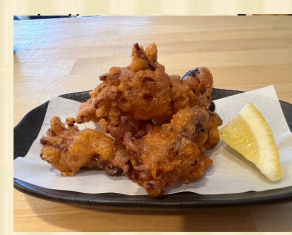
イダコのから揚げ Deep fried octopus