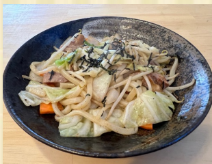
野菜たっぷり焼きうどん Stir-fried udon