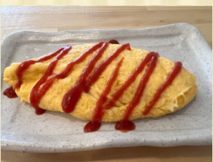
ふわとろオムレツ Soft meltin' omelet