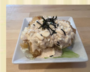
自家製タルタルチキン南蛮 Fried chicken with vinegar and tartar