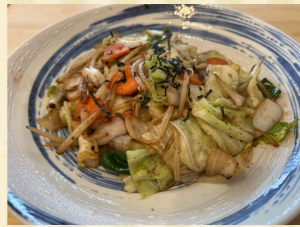
ヘルシー肉野菜炒め Stir-fried vegetable and pork