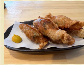
鶏皮うまいうまい餃子 Chicken wrapped Gyoza