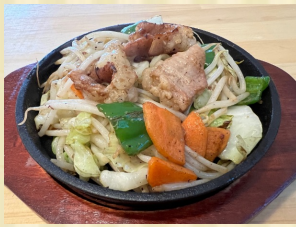
鉄板ホルモン炒め Stir-fried trippa