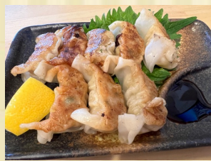
辛口島とうがらし餃子 Spicy pepper dumpling