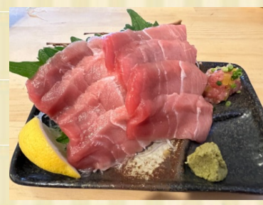
直送！中トロ刺盛り(数量限定) Tuna Sashimi (Limited Supply)