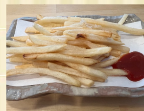
ほくほくフライドポテト French fries