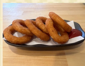
仏恥義理！鬼怨指輪 Onion Ring