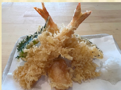
季節の天ぷら5種盛り合わせ Seasonal Tempura (5 varieties)