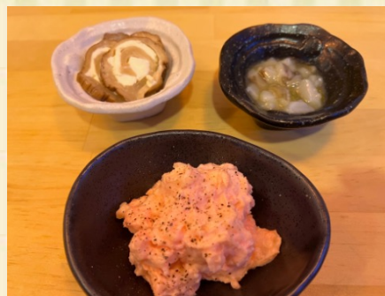
クリームチーズのいぶりがっころ Smoked pickles with cream cheese あわせ明太ポテトサラダ Potato mixed with Japanese spicy caviar こりこり食感タコワサ Wasabi marinated Octopus