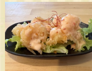
チリマヨソースの海老マヨ Deep fried shrimp with mayo and chili